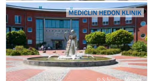
MEDICLIN HEDON KLINIK