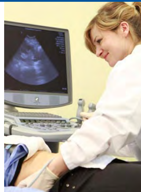
Ultraschall-Niere // Barmer GEK

Die Kassenärztliche Vereinigung Niedersachsen (KVN) hat in den vergangenen Jahren immer wieder mit Sorge auf die medizinische Versorgungssituation im ländlichen Bereich hingewiesen. Obwohl statistisch alle Regionen in Niedersachsen noch ausreichend ärztlich versorgt sind, gibt es in einigen ländlichen Gegenden schon jetzt einen Mangel an Hausärzten. Hinzu kommt, dass in den nächsten Jahren viele Ärztinnen und Ärzte aus Altersgründen aus dem Beruf ausscheiden werden. Da junge Ärztinnen und Ärzte sich aus den unterschiedlichsten Gründen nur selten auf dem Land niederlassen wollen, besteht die Gefahr, dass der Bedarf einer alternden Landbevölkerung nicht mehr ausreichend gedeckt werden kann.